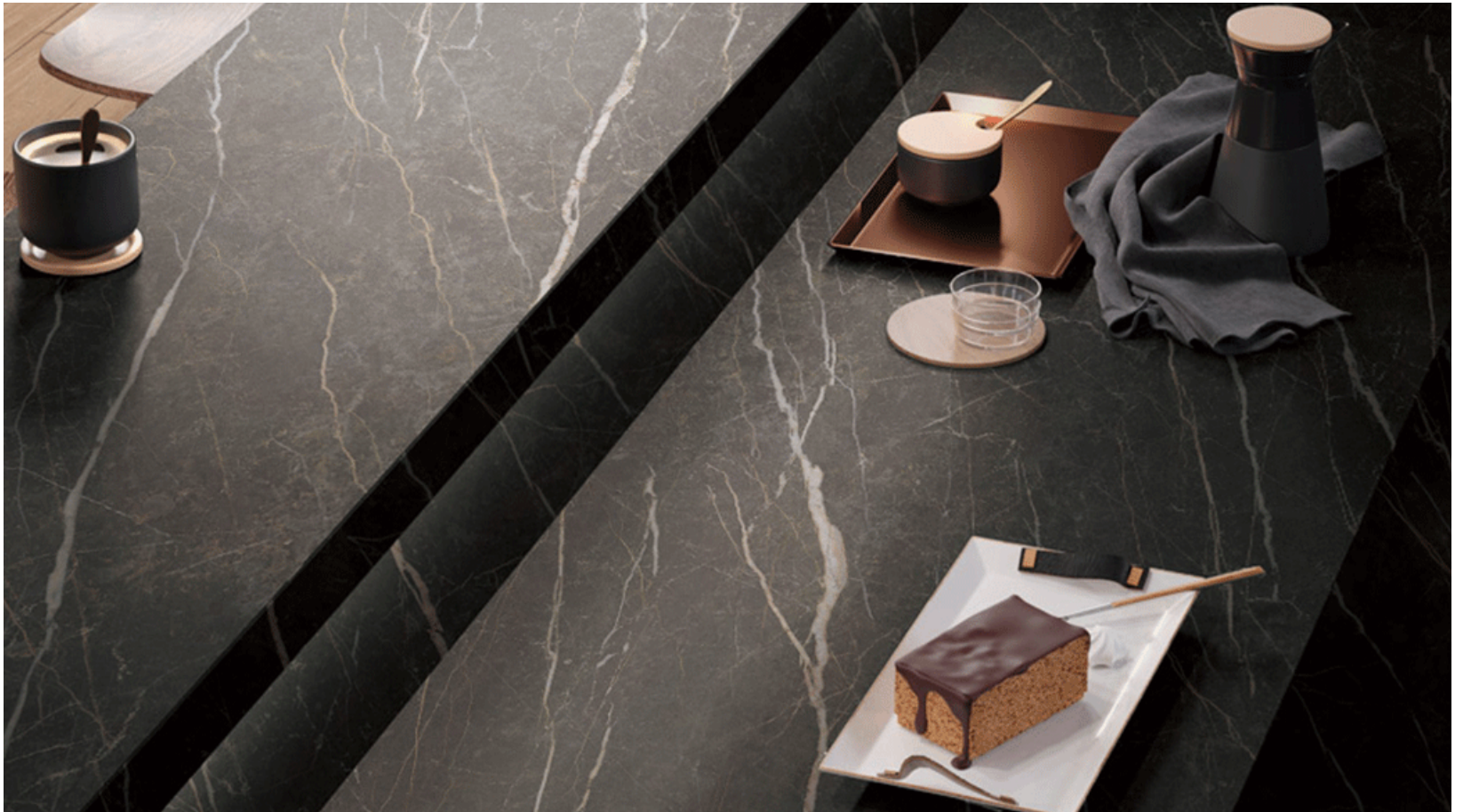
Altea Laurent Gold