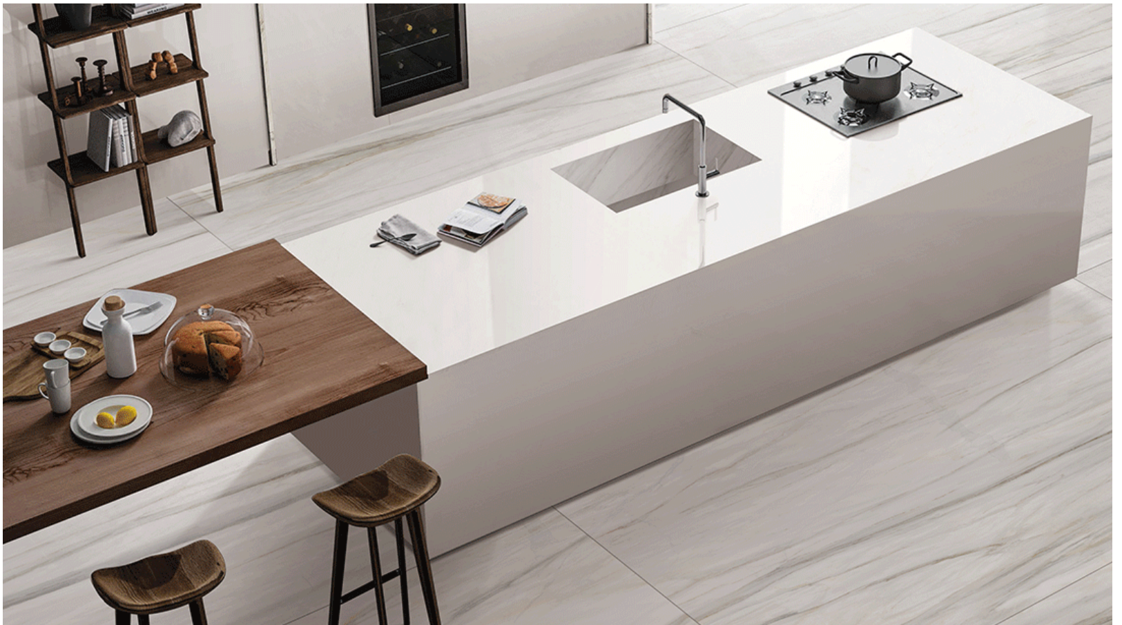
Altea Pure White