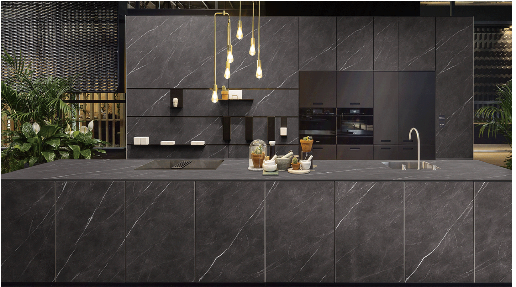
Altea Antracita Dark