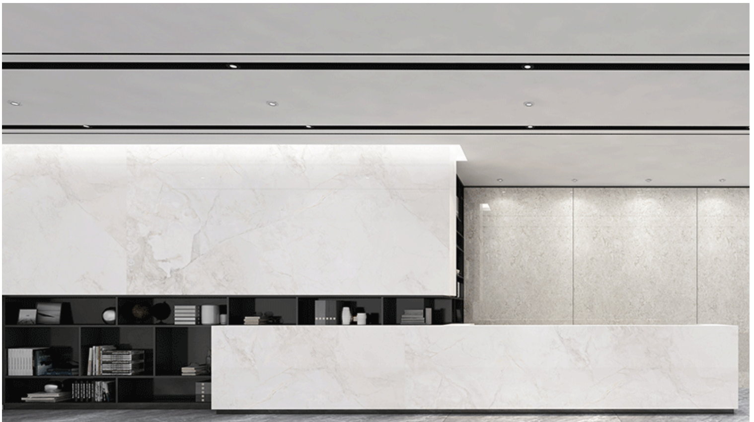
Altea Snow River