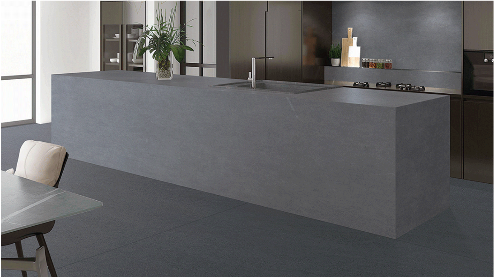
Altea Cement Grey