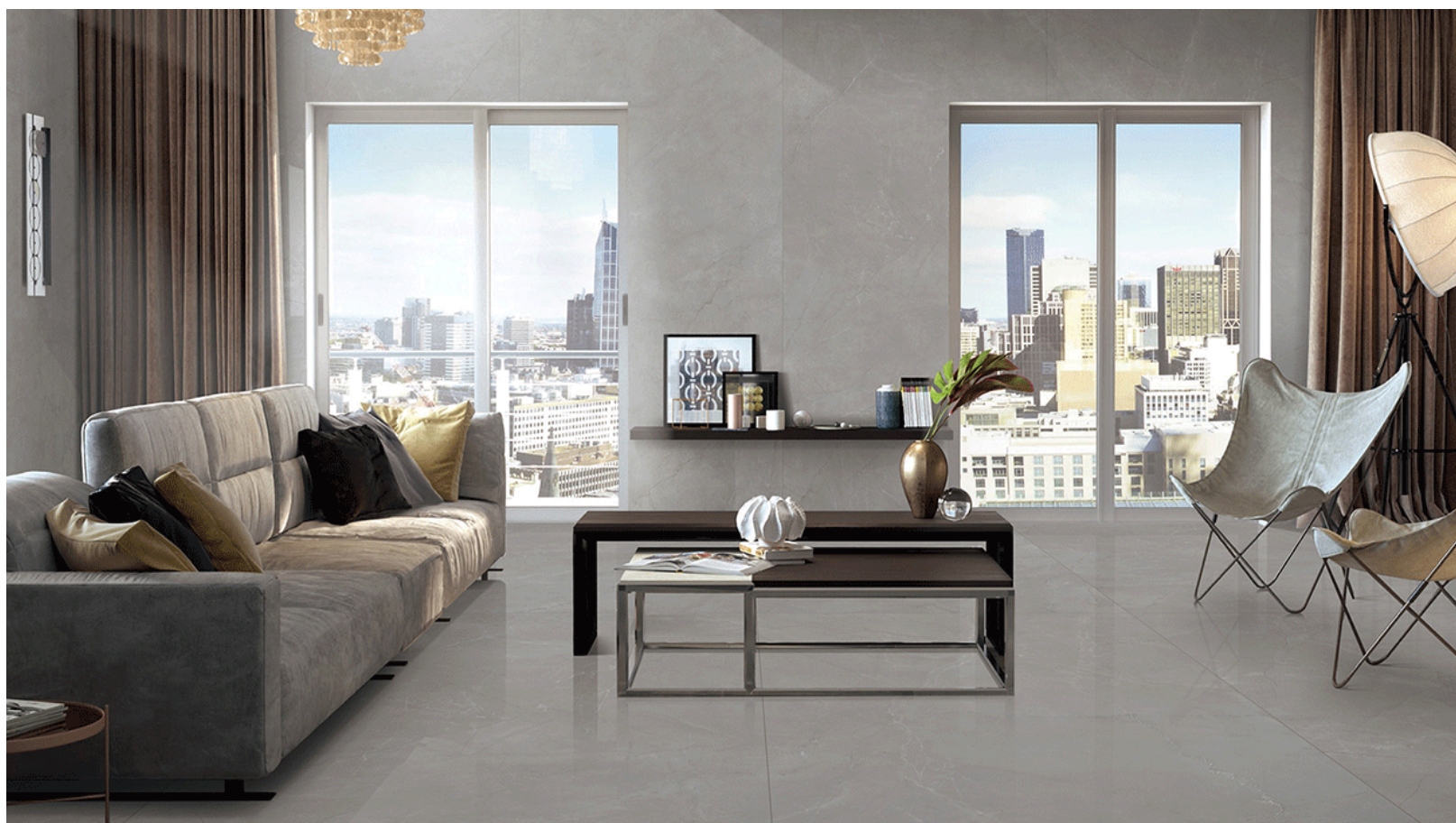
Altea Pulpis Grey