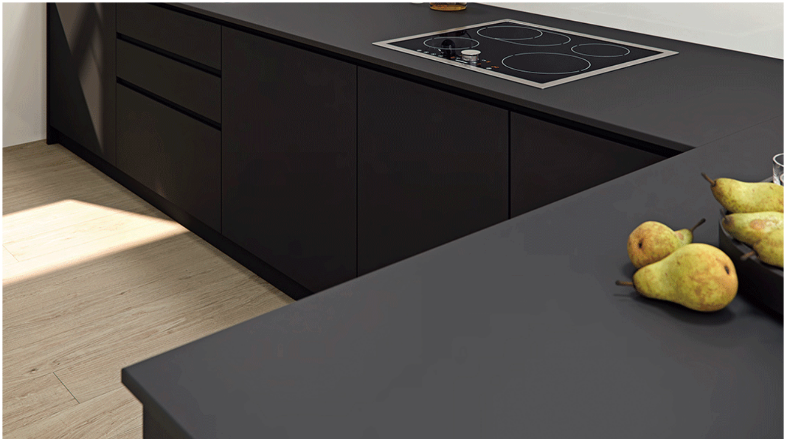
Altea Pure Black